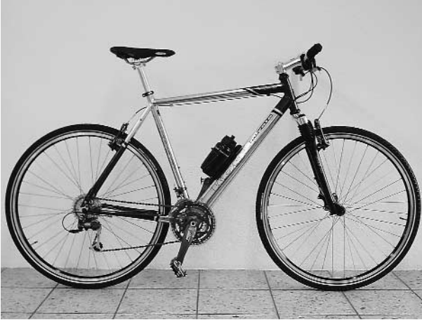
«TerraLinerAlloy» für alle Strassen und Wege

Innovation ist für Koga ein Schlüsselwort und ein Begriff dafür, jedes Jahr von Neuem die Herausforderung anzunehmen, ein vollständig neues Radprogramm von hoher Qualität zu entwickeln.