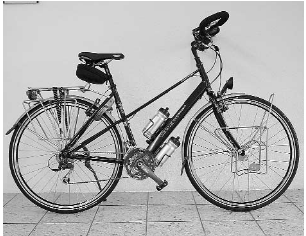
«TravellerLady» für den täglichen Fahrt und Reisen

Kommen Sie unverbindlich vorbei und sehen Sie selbst, was diese holländisch-japanische Kooperation so speziell macht.