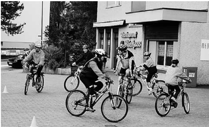
Viel Spass hatten die Teilnehmer des letzten Fahrtechnikkurses.

Mitbringen: Helm und fahrtüchtiges Bike Kosten: Fr. 40.–, Anmeldung erforderlich Max. 10 Teilnehmer