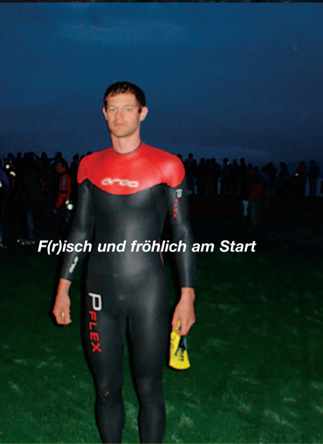
F(r)isch und fröhlich am Start

3,1 km Schwimmen - 92 km Race Bike - 30 km Mountain Bike - 25 km Berglauf totale Steigung: 5500 m - 250 Teilnehmer, davon ca. 30 Frauen Start: 06.30 Uhr im Strandbad Thun - Zielankunft: Schilthorn (3000 m)