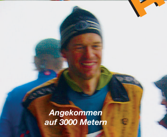
Angekommen auf 3000 Metern