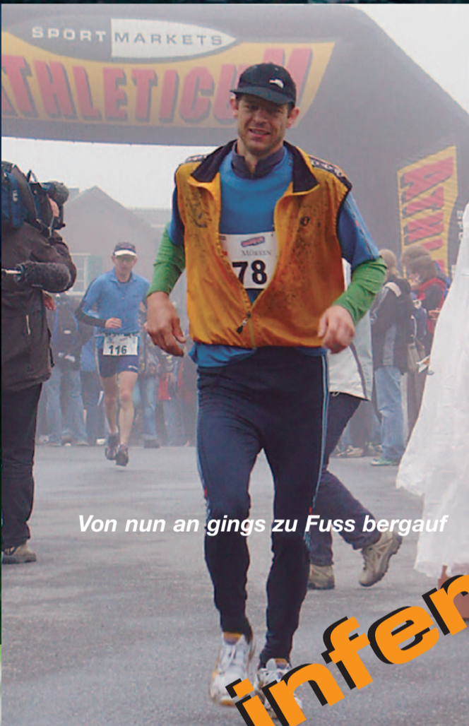
Von nun an gings zu Fuss bergauf