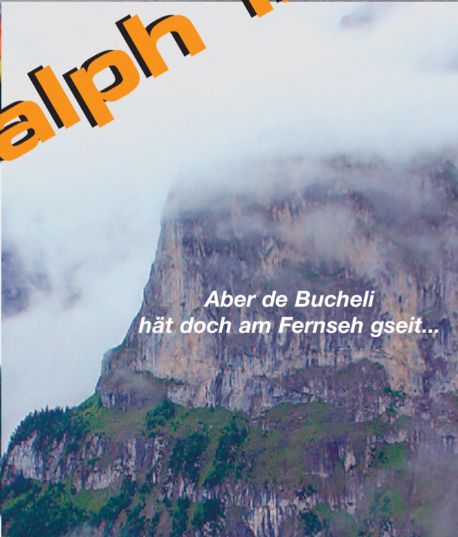
Aber de Bucheli hät doch am Fernseh gseit...