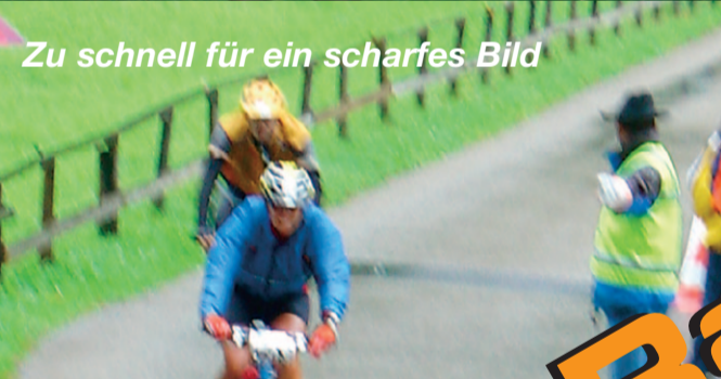
Zu schnell für ein scharfes Bild