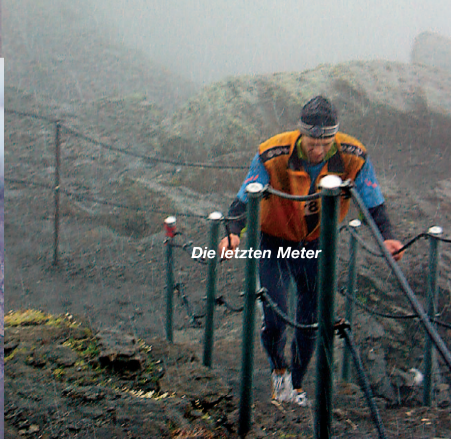
Die letzten Meter